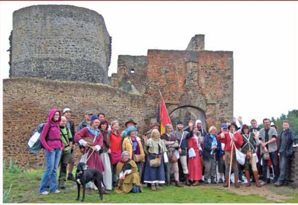
Etappe 2 Bärnau-Lauf